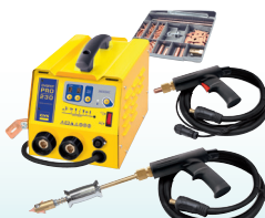
PROLINER PRO 230 - Art.-Nr. 035799 PROLINER PRO 400 - Art.-Nr. 035805