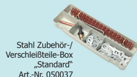
Stahl Zubehör-/ Verschleißteile-Box „Standard“ Art.-Nr. 050037