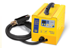
PROLINER ALU PRO FV - Art.-Nr. 035836