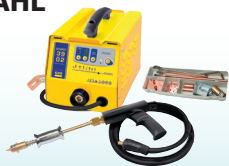
PROLINER 39.02 - Art.-Nr. 035775 PROLINER 39.04 - Art.-Nr. 035782