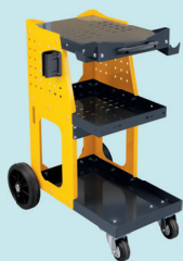
SPOT 800 Fahrwagen Art.-Nr. 051331