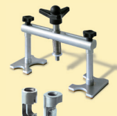
Alu Puller Art.-Nr. 051003