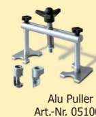
Alu Puller Art.-Nr. 051003