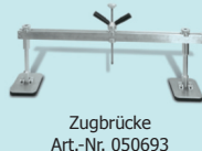
Zugbrücke Art.-Nr. 050693