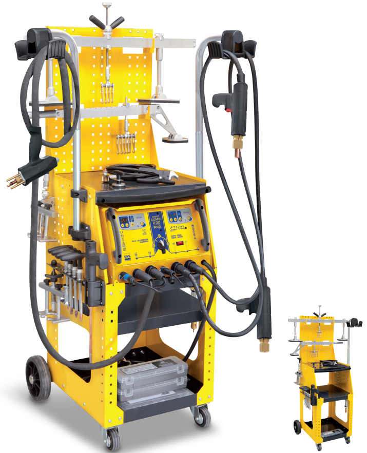
Ohne Ausbeulspotter Art.-Nr. 035058