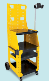
Fahrwagen Spot 1600 Art.-Nr. 051348