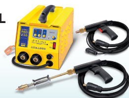
SPEEDLINER PRO 230 - Art.-Nr. 035034 SPEEDLINER PRO 400 - Art.-Nr. 035041