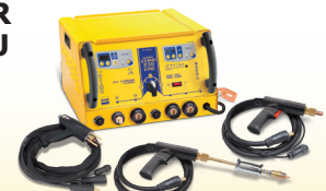
SPEEDLINER Combi 230 E PRO - Art.-Nr. 035072