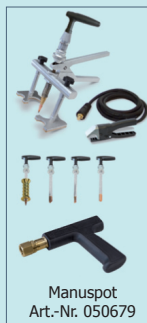
Manuspot Art.-Nr. 050679