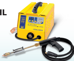
SPEEDLINER 39.02 - Art.-Nr. 035010 SPEEDLINER 39.04 - Art.-Nr. 035027