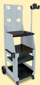
SPOT 1600 Fahrwagen Art.-Nr. 051348