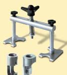
Alu Puller Komplettsatz Art.-Nr. 050921