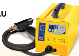
GYS SPOT ALU PRO FV Art.-Nr. 021990